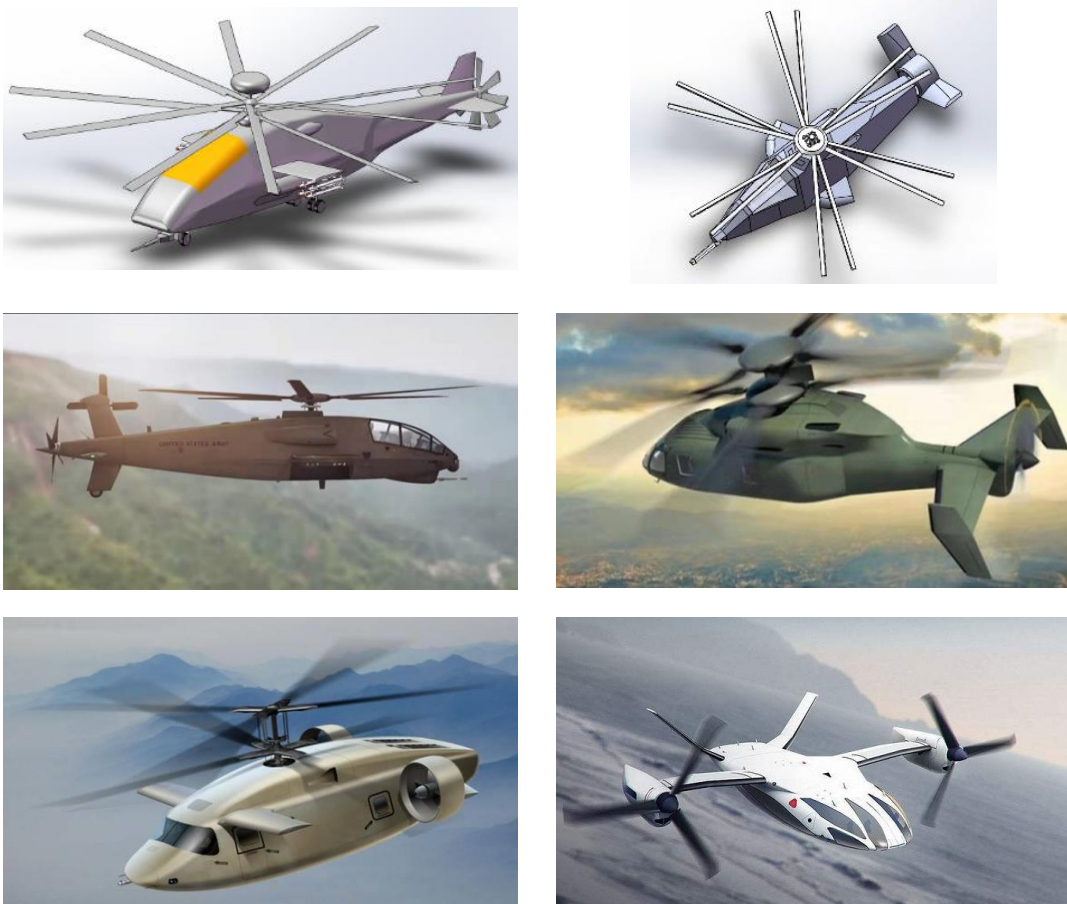
图 5 概念设计方案参考图